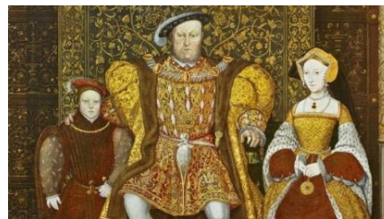
Средневековая британская семья монархов

им дары, ожидая смягчения налогового бремени и снисхождения.