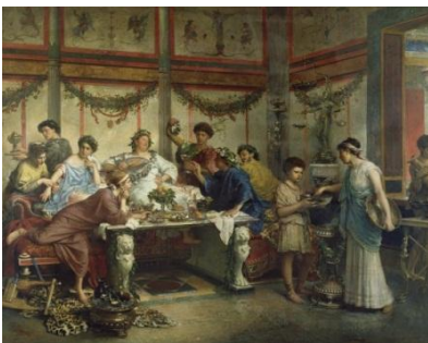
Римская знать за праздничным столом

Однако настоящими прародителями традиции дарения новогодних подарков по праву считаются древние римляне. Утопающая в роскоши знать придумывала для себя всё новые развлечения, занятия и ритуалы. Щедрые на подарки патриции подносили своим близким ветки священных деревьев, различные плоды с пожеланиями счастья.