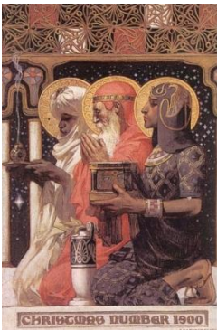
Три волхва, пришедшие к новорождённому Иисусу

Самый первый эпизод вручения подарков описан ещё в Библии. Когда родился Иисус, волхвы преподнесли ему щедрые дары: золото - в знак признания его царём, ладан - как символ божественного начала и смирену - напоминание о том, что он всё же смертен. Народы, у которых принято отмечать не столько Новый год, сколько Рождество, изначально как бы повторяли поступок волхвов.