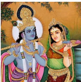
Кришна получает праздничное подношение

Так или иначе, подношение даров в истории - это знак поклонения, просьба о милости и защите. Например, египтяне дарили друг другу тотемы, статуэтки своих богов. Этот народ праздновал Новый год в период разлива Нила, то есть таким образом люди ублажали высшие силы, умоляя о хорошем урожае. Боги Олимпа регулярно получали от греков ягнят, а Кришна - блюда из риса, благовония и цветы.